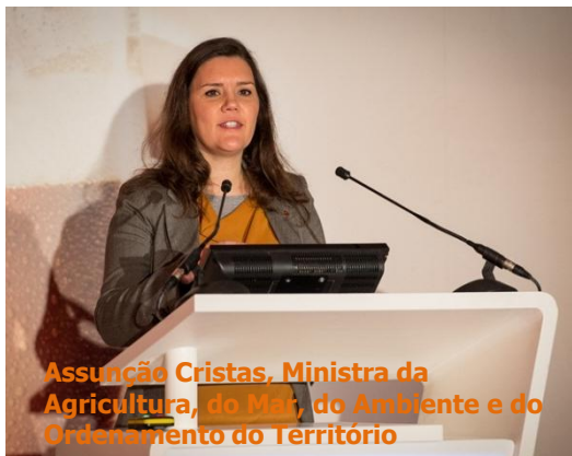
Assunção Cristas, Ministra da Agricultura, do Mar, do Ambiente e do Ordenamento do Território