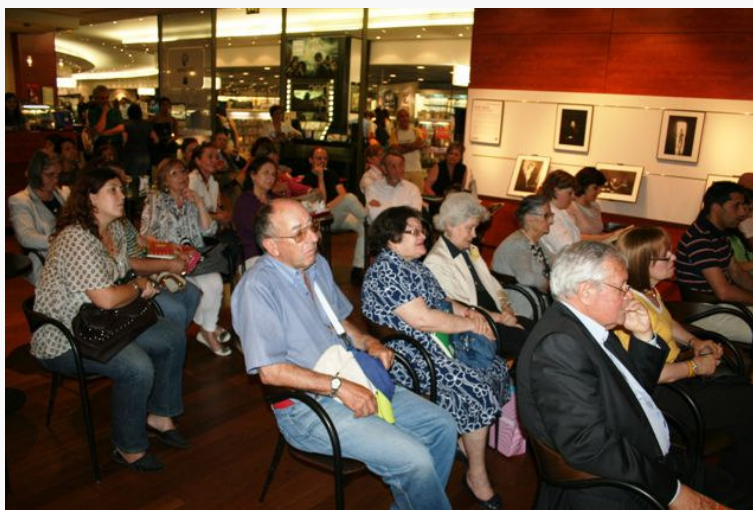
Aspecto geral da audiência na FNAC-Colombo

Este livro está à venda nas livrarias portuguesas, nomeadamente na FNAC, com o preço de € 14,70, podendo ainda ser encomendado directamente ao editor Feitoria dos Livros, através do e-mail feitoriadoslivros@sapo.pt